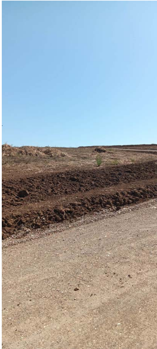
Figure 5 e 6

La strada è privata, è realizzata con misto di cava stabilizzato a calce che la rende permeabile. Una strada bianca che non necessita di cessione di aree pubbliche o di interventi pubblici per la sua realizzazione.